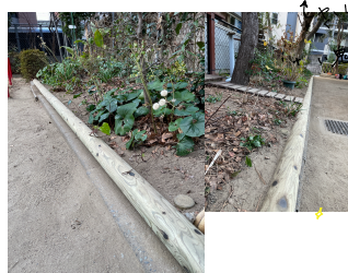
綺麗になった花壇